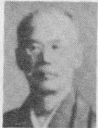
宮中顧問官 井上通泰